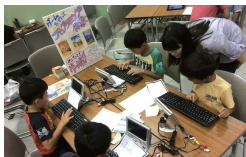
キーボードとテレビを つないでつかいます