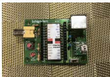
IchigoJam 1,500 円～